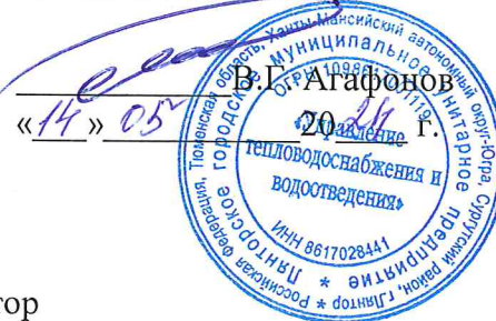
График промывки магистральных/внутриквартальных сетей ТС, г.п. Лянтор на 2024 год